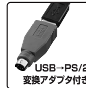
USB→PS/2 変換アダプタ付き