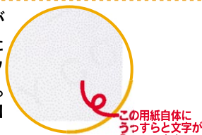
この用紙自体にうっすらと文字が入っています。